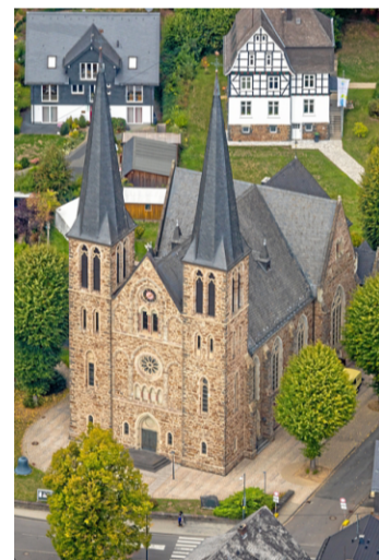
Die katholische St. Martin-Kirche in Netphen.